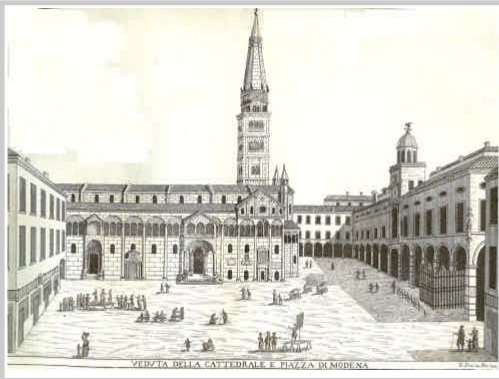
Modena di fine '700.