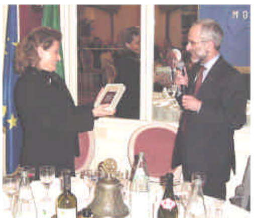
Il Presidente presenta la targa –ricordo