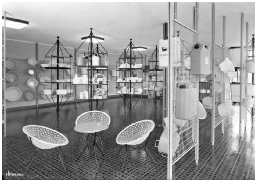
Aziende Modenesi - LAR SpA - Sala di esposizione