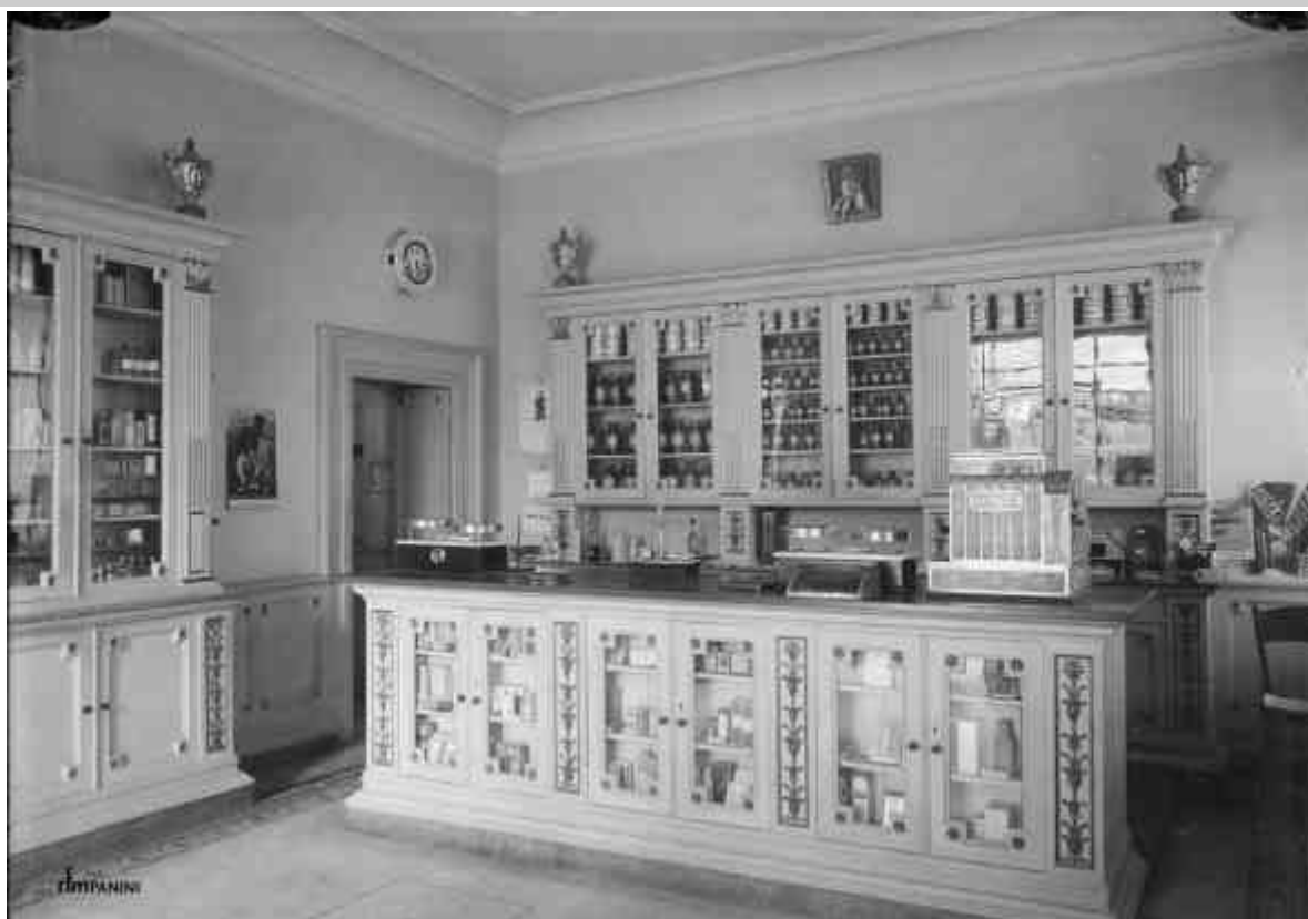
Farmacia dell'Ospedale Civile S. Agostino, Modena 1940 ca.

Mensile di informazione riservato ai Soci del Club