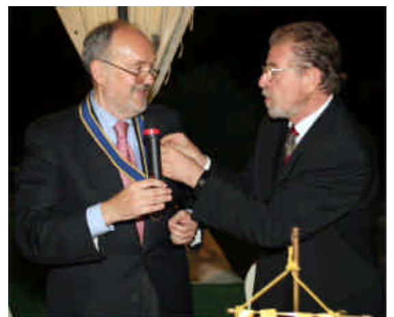
Il passaggio delle consegne