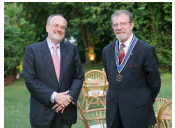
I due Presidenti prima della cerimonia del passaggio

Al nuovo Presidente gli auguri di tutta la Commissione stampa.