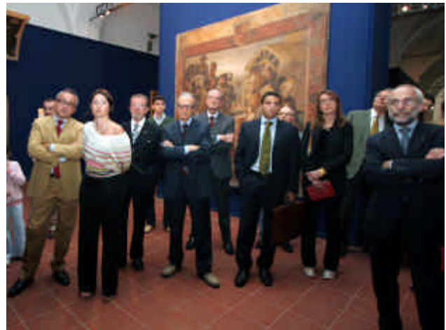
Rotariani in visita alla Mostra di Nicolò dell'Abate