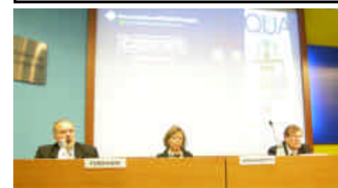
Un momento del Convegno sull'acqua