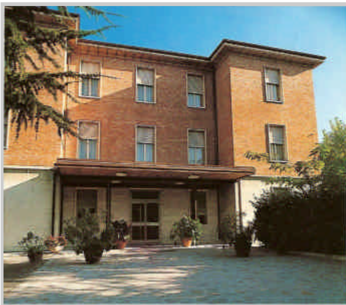
Casa di Cura Villa Rosa Modena , c.a. 1960