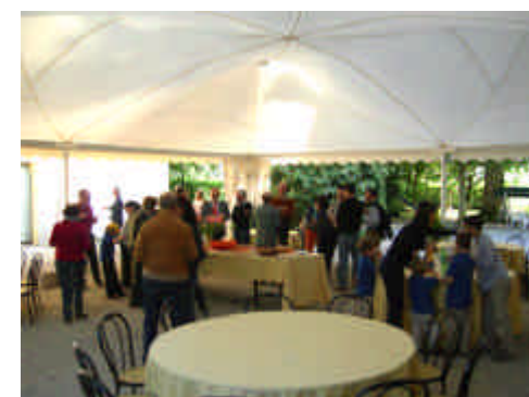
Alcuni momenti della Festa della famiglia

A modificare leggermente la scaletta degli interventi è la partecipazione, imprevista ma graditissima, dell'Ambasciatore del Congo in Italia, che essendo a Modena per altre ragioni, e saputo del Convegno, ha voluto partecipare per portare la sua testimonianza su un problema molto sentito nella sua terra; questa è stata così anche l'occasione per ringraziare il Rotary di Vignola e gli altri, tra cui Modena, che hanno portato a termine il "service" per donare potabilizzatori di acqua alla città congolese di Goma.