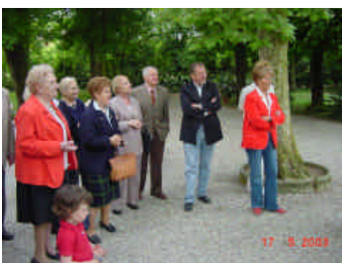
Due momenti della manifestazione