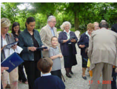
La distribuzione dei gadgets alle signore