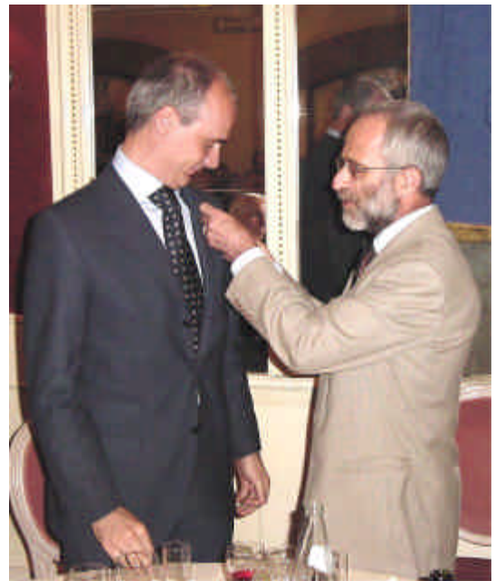
Il Presidente consegna il distintivo