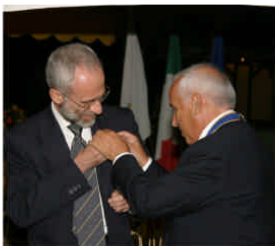
Il cambio dei distintivi