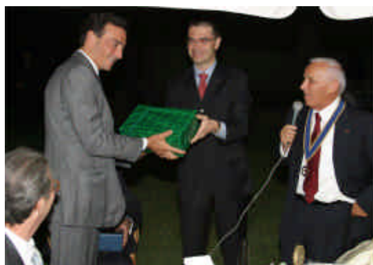
Il cambio dei Segretari