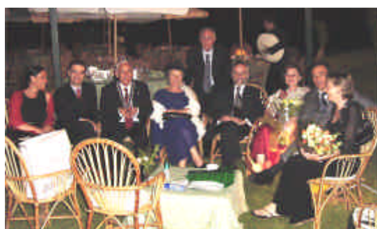
Foto di gruppo a fine serata con il padrone di casa

vole, volge al termine, dobbiamo ridiscendere nell'afa della pianura, l'appuntamento è fra una settimana con la nuova squadra già al lavoro con la riunione del Consiglio Direttivo.