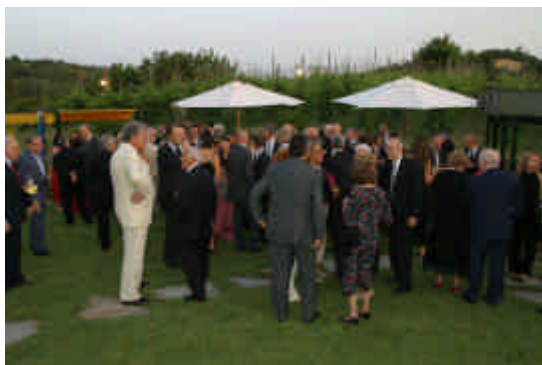
L'arrivo degli ospiti