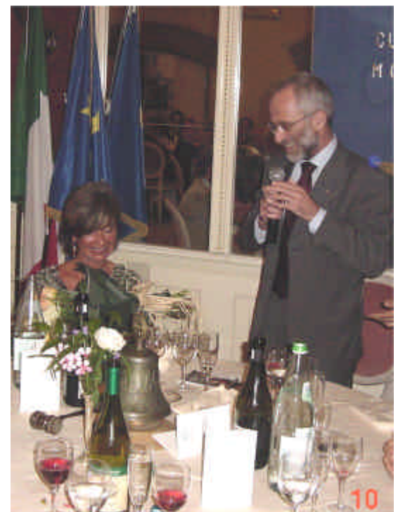
L'omaggio floreale a fine serata